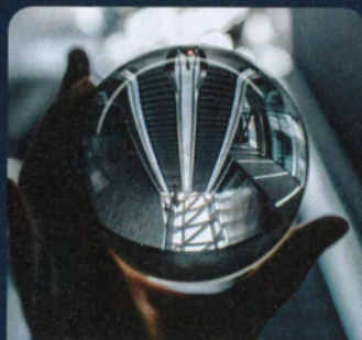
Die Rolltreppen, die die einzelnen Messehallen verbinden, blieben – wie in diesem Symbolbild – in diesem Frühjahr in Essen leer.