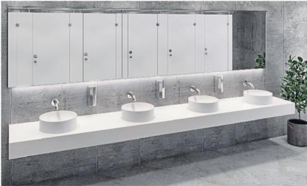
Eine Varicor-Vierfachwaschtischanlage mit Clea-P-Aufsatzwaschtisch.

Ergänzt wird das Varicor-Programm ab sofort durch sechs neue Aufsatzmodelle – je nach Bedarf von rund über oval bis eckig. In der Version als Einzelbecken können diese mit Ablagen aus Varicor, aber auch mit anderen Materialien oder mit Unterbaumöbeln kombiniert werden. Lieferbar sind die Modelle auch als komplette Waschtischlösung, bei der das Becken inklusive der maßvariablen Ablagefläche in einem Stück gegossen wird. Der Produktvorteil hierbei: Der angeformte Radius am Übergang zwischen Becken und Ablage macht die „Problemzone Silikonfuge“ hinfällig und ist besonders reinigungsfreundlich. Das Ablaufventil mit der farblich passenden Abdeckung aus Varicor ist bei jedem Becken im Lieferumfang enthalten. Ebenfalls neu ist der Umstand, dass die Produkte aus Varicor jetzt auch in ECO-Rezeptur erhältlich sind.