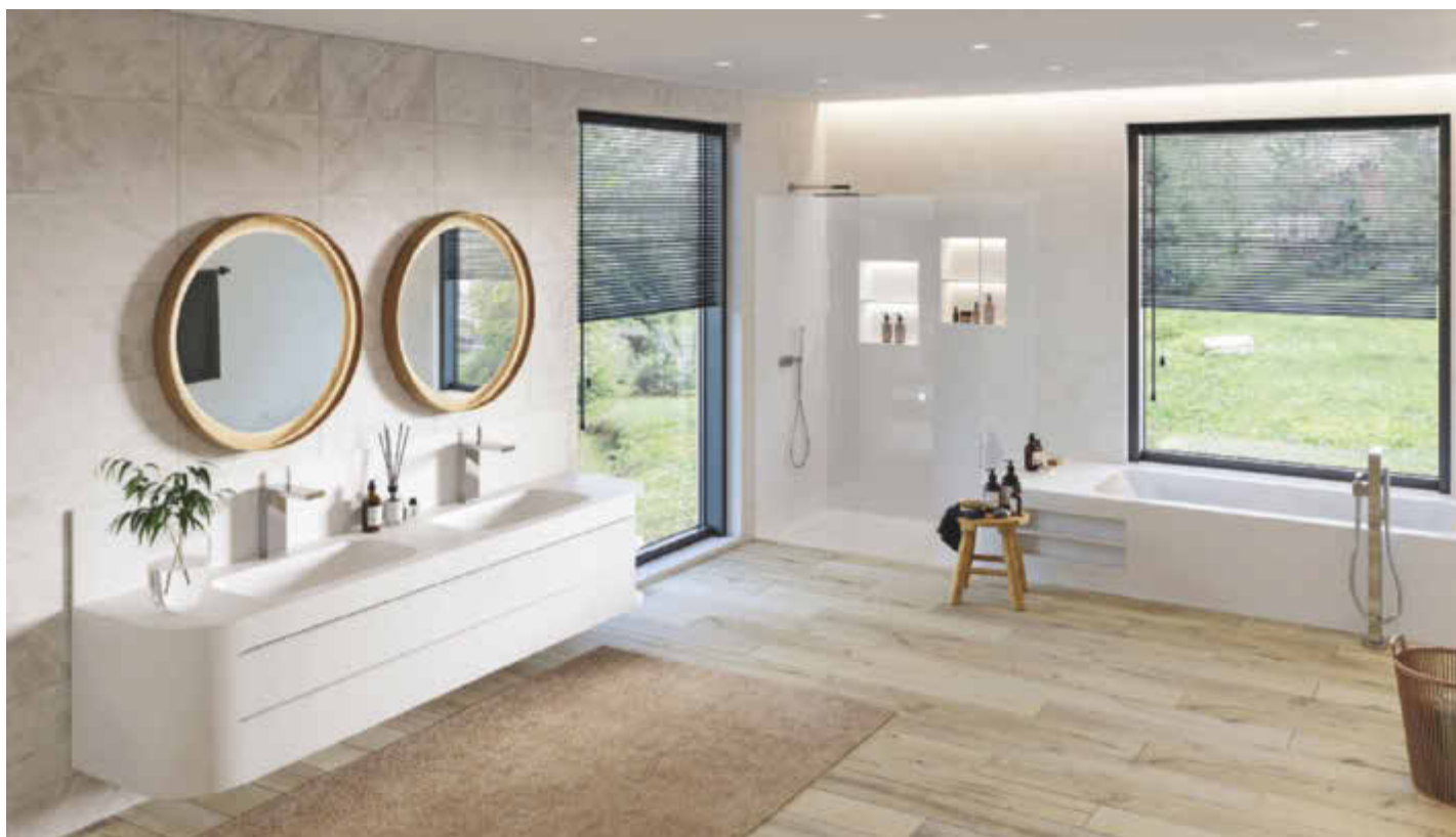
/ Varicor ergänzt sein Lieferprogramm um insgesamt 35 neue Formen in sieben Designfamilien: Neben verschiedenen Waschbecken wurden auch eine neue Badewanne und eine Duschwanne entwickelt.