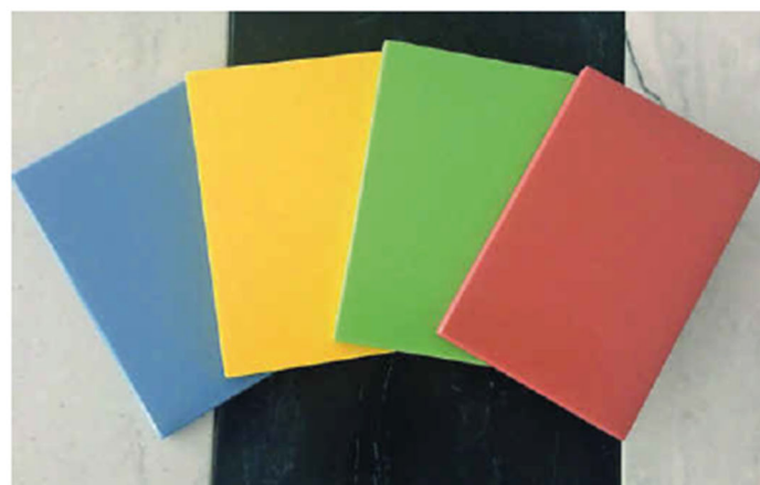
Neue Farbstellungen bereichern das umfangreiche Programm von Varicor. Neben Standardmaßen gibt es auftragsbezogene, verschliffene Formate.

Mineralwerkstoffspezialist Varicor produziert – neben Plattenware in verschiedenen Standardmaßen – auftragsbezogene Formate. Auch die Plattenstärke kann projektbezogen individuell hergestellt