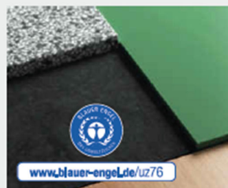
FunXTional Products: vielseitige Lösungen für den Möbel- und Innenausbau.

Erweiterung des zertifizierten Portfolios verschafft Architekten, Innenausbauern und Möbelherstellern entscheidende Vorteile im Objektgeschäft.